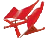
ARATRO 180° VOLTAOR.