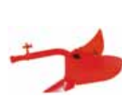
ASSOLCATORE PER FRESA 19/21