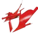
ARATRO 90° VOLTAOR.